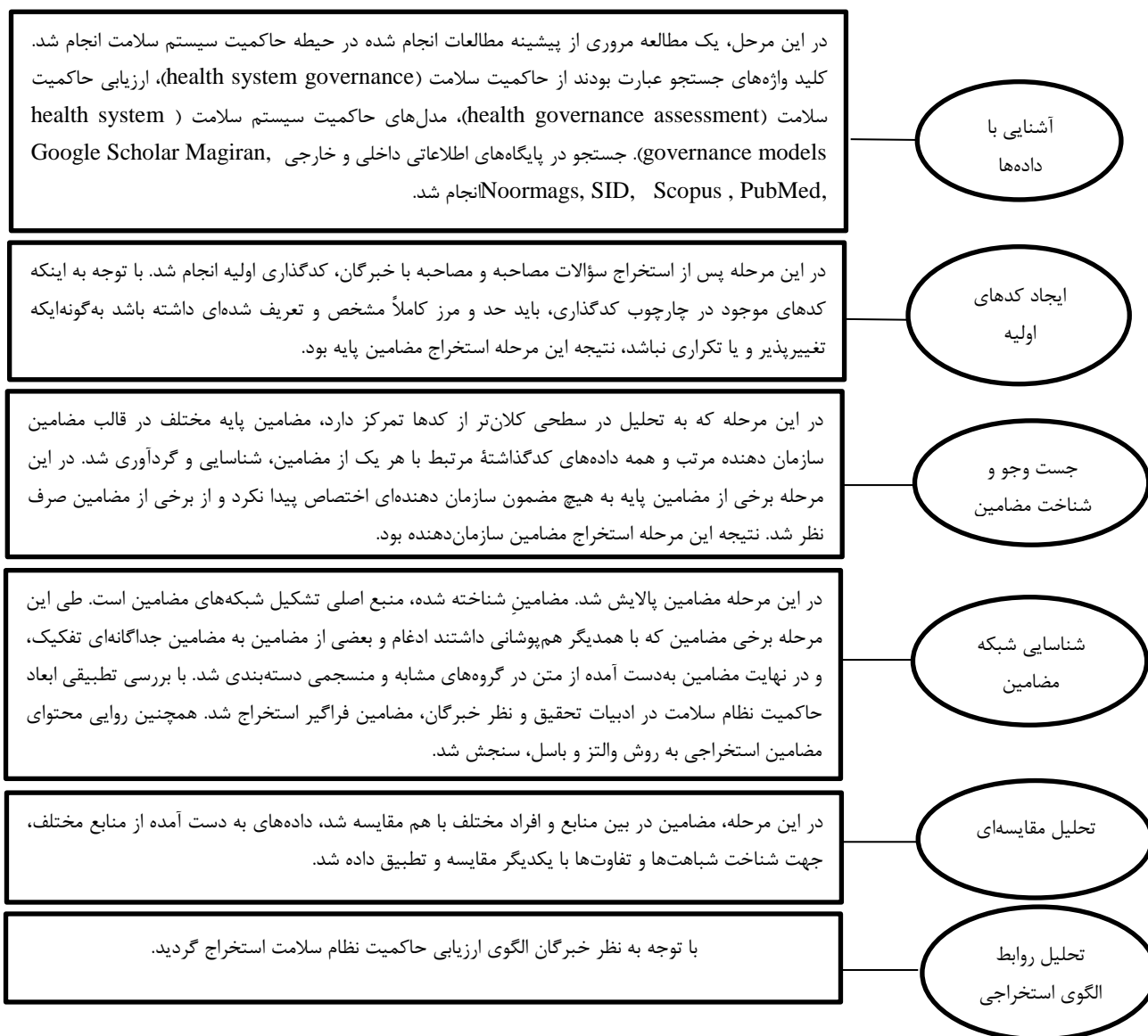
شکل ۱: مراحل انجام پژوهش

پیش از آغاز مصاحبه، فرم رضایت‌نامه کتبی شرکت در مصاحبه به امضای خبرگان رسید و به آن‌ها اطمینان داده شد که می‌توانند در هر مرحله از مطالعه از ادامه همکاری خودداری ورزند. علاوه بر یادداشت‌برداری، مصاحبه‌ها با رضایت خبرگان توسط موبایل ضبط شد. در انتهای مصاحبه، نحوه تماس با آن‌ها مشخص شد تا در صورت نیاز، امکان برقراری ارتباط‌های بعدی نیز فراهم شود. بلافاصله پس از پایان هر مصاحبه، مکالمات پیاده‌سازی شد. هر مصاحبه به طور متوسط ۲ ساعت طول کشید.