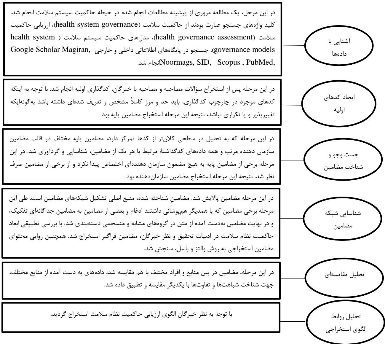
شکل ۱: مراحل انجام پژوهش

به منظور تامین هدف پژوهش، داده‌ها با روش اسنادی و مصاحبه عمیق با خبرگان وزارت بهداشت، درمان و آموزش پزشکی جمع‌آوری شد. زمان و مکان انجام مصاحبه‌ها با توجه به خبرگان و هماهنگی‌های قبلی با ایشان تعیین شد. پس از هماهنگی‌های اولیه، سؤالات مصاحبه و پروپوزال تحقیق با مراجعه حضوری یا ارسال از طریق دورنما یا پست الکترونیکی در اختیار خبرگان قرار گرفت. این امر به آماده‌سازی ایشان برای شرکت در مصاحبه کمک کرد. علاوه بر این فرم، در ابتدای مصاحبه، مصاحبه‌گر توضیحاتی شفاهی درباره مطالعه و اهداف آن و تمهیدات محرمانه ماندن اطلاعات ارائه داد؛ سپس،