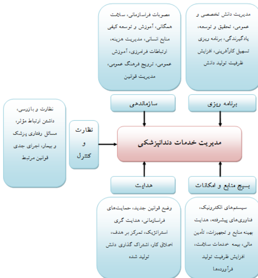
شکل ۲: مدل پیشنهادی مدیریت خدمات دندانپزشکی

سطح خطای متداول و استاندارد جهت بررسی روابط ۰/۰۵ و سطح اطمینان ۰/۹۵ بود. تحلیل داده ها نشان داد که متغیرهای برنامه ریزی، سازماندهی، بسیج منابع و امکانات، هدایت و نظارت و کنترل با ضریب تأثیر ۰/۱۷۳، ۰/۷۰۴، ۰/۱۹۳، ۰/۰۳۴ و ۰/۲۷۳ در سطح معنی داری ۰/۰۵ بر مدیریت خدمات دندانپزشکی تأثیر معنی دار و مثبت