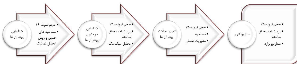
شکل ۱: مراحل تحقیق

پیشران‌ها ۳۰ تا ۵۰ دقیقه مصاحبه با ۱۵ نفر از خبرگان دانشگاهی در رشته‌های مدیریت صنعتی، مالی و مدیریت بهداشت و درمان و خبرگان موجود در زنجیره تأمین بهداشت و درمان گرفت. متوسط زمان مصاحبه‌ها ۴۳ دقیقه بود. از طریق مصاحبه و با استفاده از روش تحلیل تماتیک ۱۴ عامل اثرگذار استخراج شد. جدول ۲ بیانگر آمار توصیفی خبرگان است.