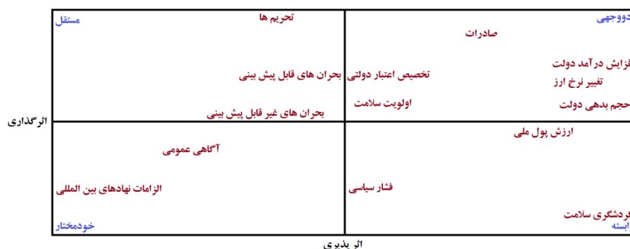
شکل ۲: پراکندگی متغیرها و جایگاه آن‌ها در محور تأثیرگذاری-تأثیرپذیری بر اساس تأثیرات مستقیم

پراکندگی متغیرها و جایگاه آن‌ها در محور تأثیرگذاری-تأثیرپذیری بر اساس تأثیرات مستقیم در شکل ۲ آمده است. متغیرها را می‌توان بر اساس موقعیت آن‌ها در ماتریس به متغیرهای تأثیرگذار، متغیرهای خودمختار، متغیرهای وابسته و