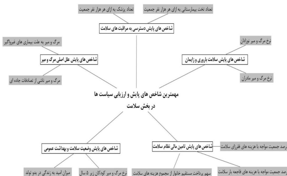
شکل ۲: مهم‌ترین سنجه‌های قابل‌اندازه‌گیری و هدف‌گذاری در بخش سلامت

بین ۲۰ کشوری که بهترین نظام سلامت را در سطح جهان دارند ۱۷ کشور از اتحادیه اروپا هستند. کشورهای اتحادیه اروپا به‌ویژه فرانسه، ایتالیا، اسپانیا و اتریش در مجموع ابعاد نظام سلامت شامل سطح سلامت، عدالت در توزیع سلامت، بار مالی هزینه‌های خدمات سلامت و عملکرد سلامت در جایگاه مطلوبی قرار دارند). ارائه شد.