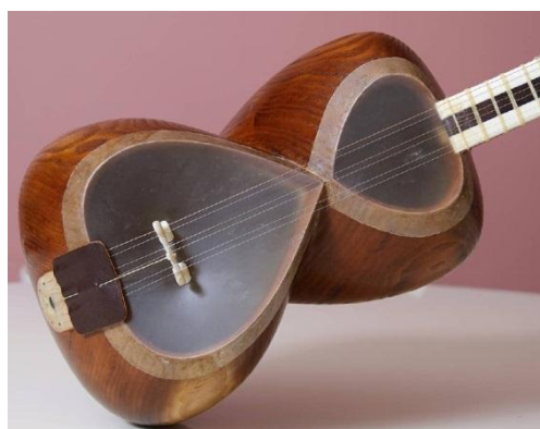
شکل ۱: ساز تار ایرانی (که دارای ۳ جفت سیم است)